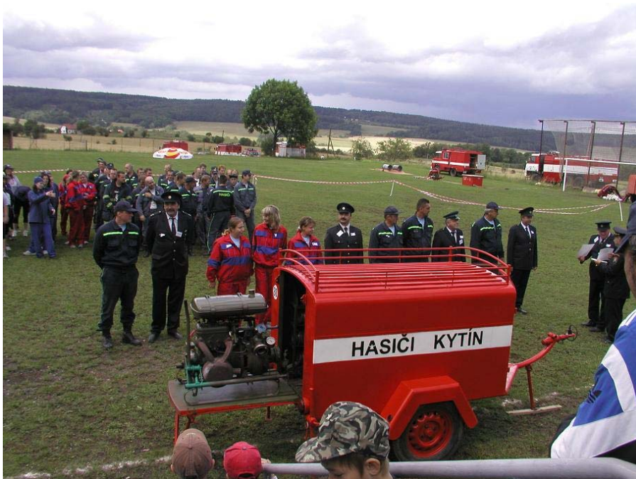
Soutěž hasičských jednotek na kytínském hřišti