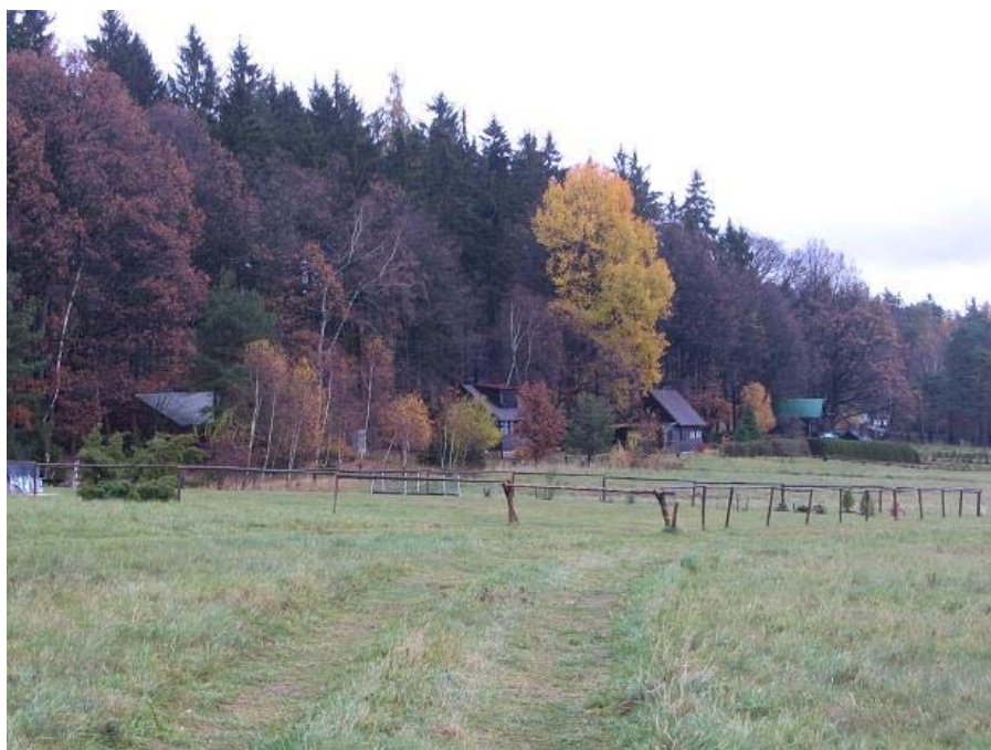
Chatová osada Na Rovinách