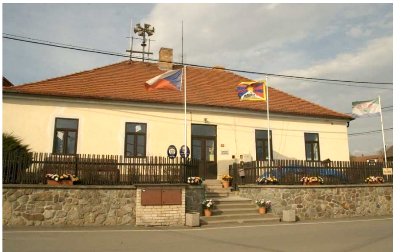
Dagmar Čechová